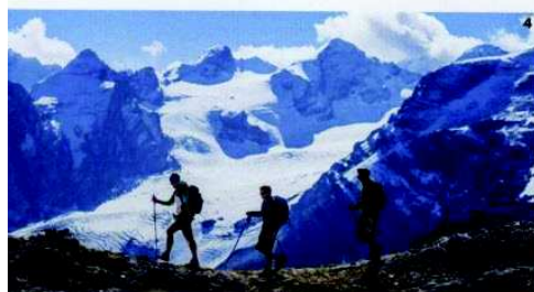
1 | In bici sul Giro dei Laghi di Cancano . 2 | I formaggi della Latteria di Bormio , punto vendita della storica Latteria Sociale. 3 | Da Metallia , a Bormio , arredi, accessori e stoviglie di montagna. 4 | Trekking sul Passo dello Stelvio ; sullo sfondo, il ghiacciaio dell'Ortles . 5 | Una camera dell' Hotel La Genzianella , dedicato ai ciclisti.

sti, 25 si pregustano già da casa con il nuovo Trekker Loan Program di Google, che da poco ha mappato il comprensorio escursionistico dell'Alta Valtellina. Spicca il Giro del Confinale , nella natura più incontaminata del Parco dello Stelvio, tra la Val Zebrù , la Val Cedee e la Valle del Confinale ( girodelconfinale.it ). Si può seguire a piedi o in mountain bike. Su due moduli: il primo, di tre giorni, adatto anche alle famiglie, prevede tappe da quattro a sei ore; il secondo, di due giorni, per camminatori e i biker esperti, vede tappe di sei-otto ore. Sem-